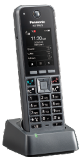
Podgląd całego modelu