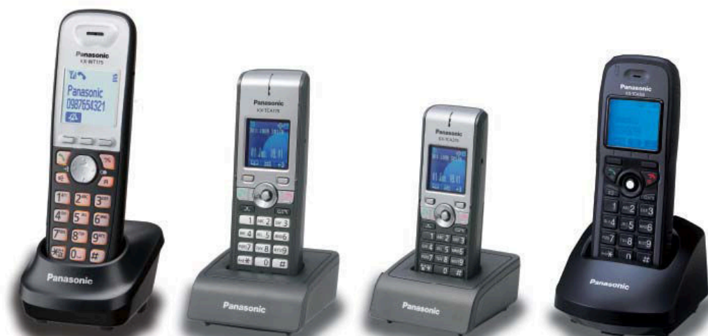
Model podstawowy KX-WT115