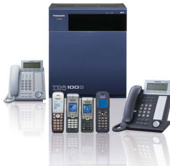
LINIA PRODUKTÓW KX-TDA100D

Centrala abonencka KX-TDA100D to platforma biznesowa rozwijająca się razem z przedsiębiorstwem. System jest gotowy do użytku z szerokim zakresem telefonów PSTN, linii PSTN, linii IP, telefonów IP, systemem CTI opartych na technologii IP oraz całą rodziną aplikacji do komunikacji biznesowej.