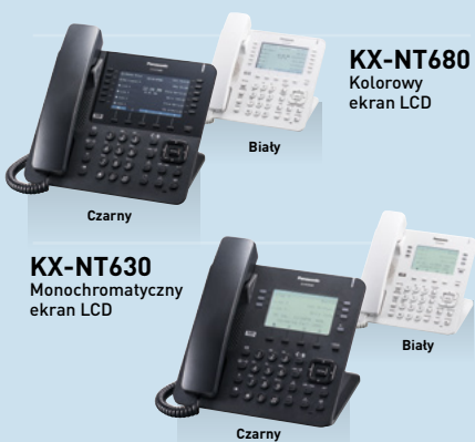
KX-NT680 Kolorowy ekran LCD