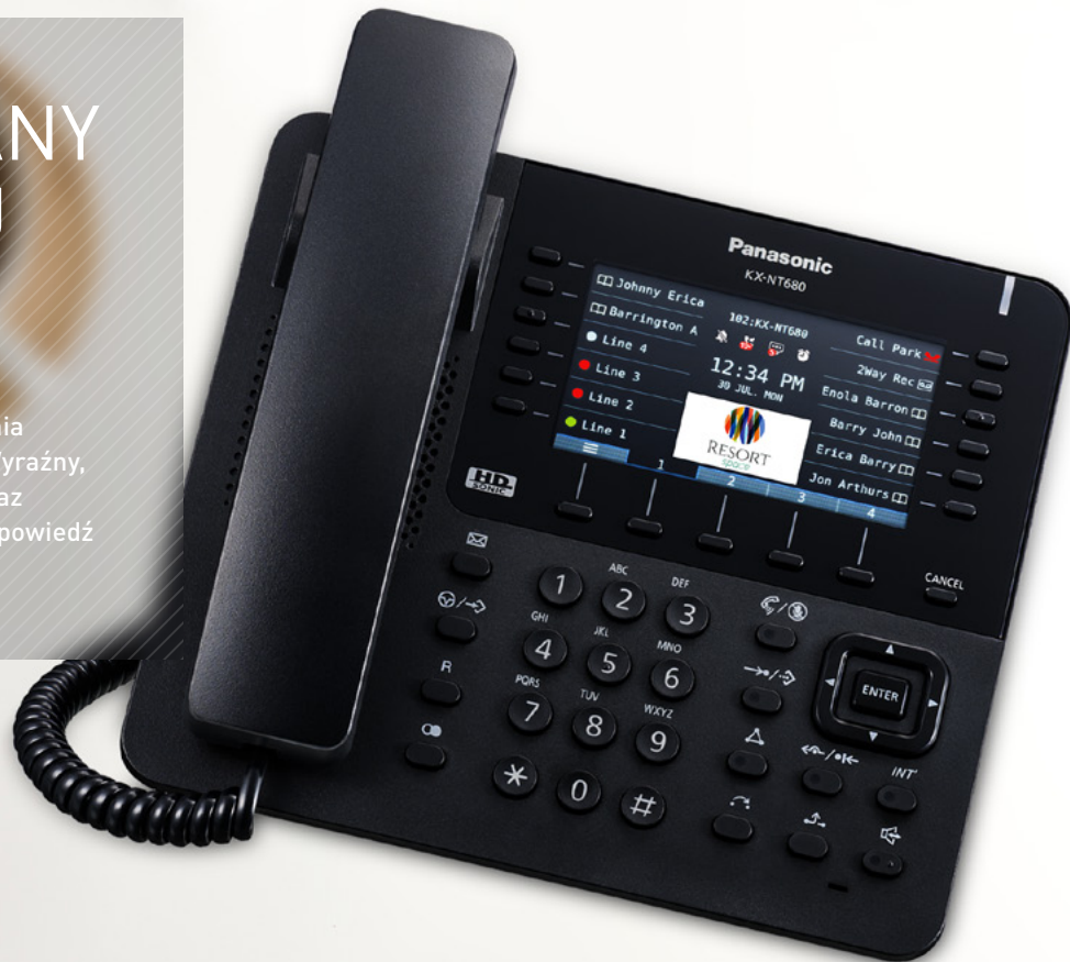
HD SONIC KX-NT680 Kolorowy ekran LCD

Z myślą o nieustannie zmieniającym się świecie biznesu, firma Panasonic tworzy nowe urządzenia komunikacyjne gotowe na przyszłe wyzwania. Wyraźny, kolorowy ekran LCD, dźwięk wysokiej jakości oraz udoskonalony interfejs użytkownika to nasza odpowiedź na wymagania użytkowników.