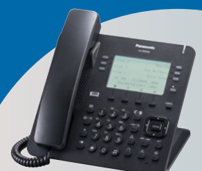
KX-NT630 Monochromatyczny ekran LCD

*W przypadku wyświetlania obrazu lub kodu QR obraz może nie być czytelny dla urządzenia odczytującego (w zależności od wielkości kodu QR).